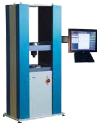
35-5100 Universalprüfmaschine 200 kN Universal Testing Machine 200 kN