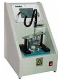
20-2200 Ring- und Kugelautomat Automatic Ring and Ball Tester